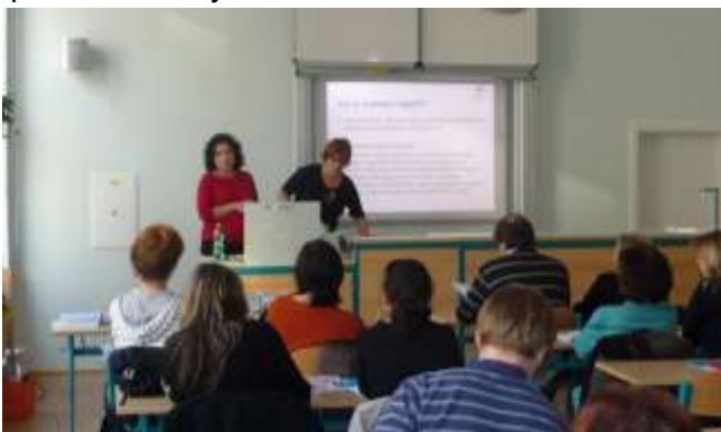
Školení učitelů probíhalo ve spolupráci se ZŠ Mendíků

Podle průzkumu o.s. ROSA mezi učiteli pražských základních škol celých 26,5 % pedagogů už sice měli podezření na domácí násilí v rodině žáka, ale nevěděli jak do situace vstoupit. Třicet pět procent pedagogů už násilí v rodině žáka řešilo a z toho více jak polovina už informovala o situaci v rodině Oddělení sociálně právní ochrany dětí či Policii ČR.