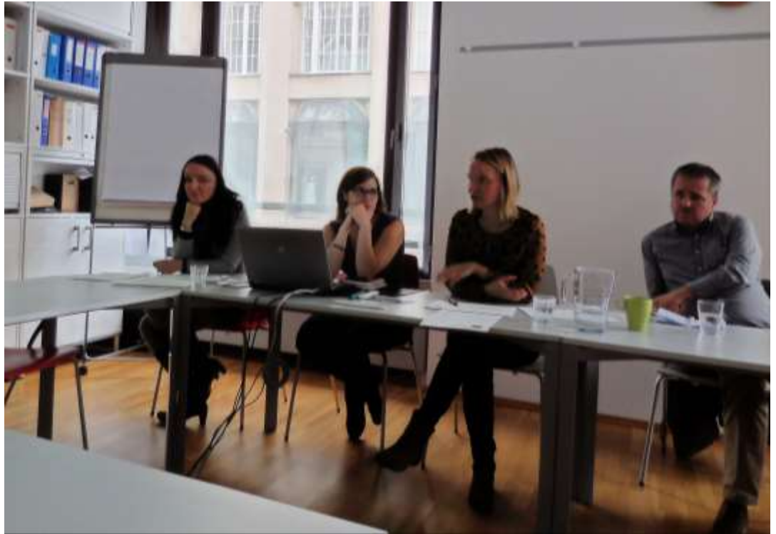
Pracovnice IC města Vídeň a policista Harald Hofmayer (vrchní policejní komisař města Vídeň).

k ublížení na zdraví, či že je zde hrozba nějakého násilí. Vykázání se týká všech - bez ohledu na věk, vzdělání, národnost. Nerozhoduje, zda je to byt násilné osoby, okamžitě osobu vykáží, odeberou klíče, nesmí se do bytu či domu vrátit po dobu 14 dní. Pak je možné vykázaní rozšířit i na zákaz přiblížení se k mateřské školce, škole, pokud má ohrožená osoba děti do věku 14 let. Policie dohlíží na vykázaní, během tří dnů od vykázaní jede zkontrolovat, zda je příkaz dodržován. Pokud není a násilná osoba se vrátí, dostane okamžitě pokutu 360 EURO, pokutu dostane i oběť, pokud nařízení porušila a násilnou osobu vzala do bytu. Během 14 dnů si pak oběť podá žádost o předběžné opatření k soudu, tím jde prodloužit vykázaní o 2 týdny. Při vstupu policie do bytu, musí policie oddělit oba účastníky od sebe, poučit oběť o jejich právech ale i o sankcích, poučen je i násilník,